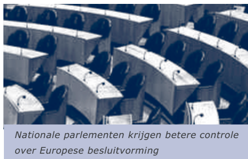
Nationale parlementen krijgen betere controle over Europese besluitvorming

“Wij maken ons ernstig zorgen over het bedroevende democratisch gehalte van de Europese Unie”, zo staat op de website van het Comité Grondwet Nee te lezen. Die zorgen deel ik ten volle. Immers, in de huidige situatie is de Europese overheid weinig transparant, representeert zij onvoldoende en bemoeit zij zich soms met zaken die beter dichterbij de burger geregeld kunnen worden.