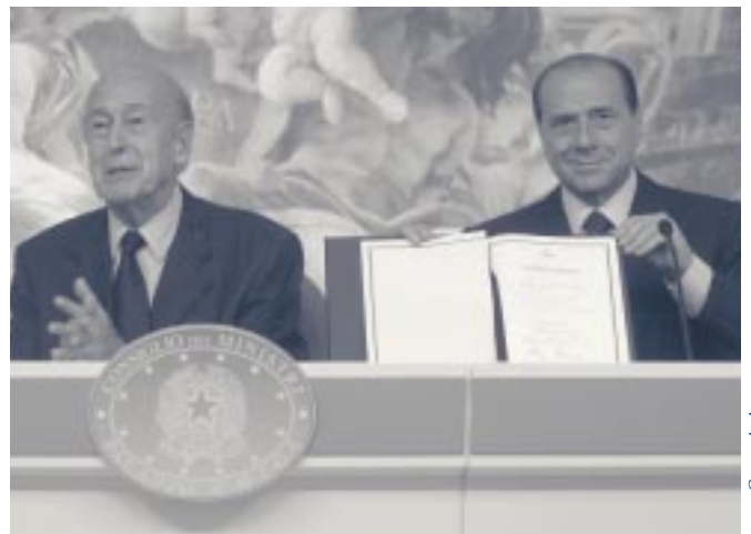
Giscard d'Estaing en Berlusconi presenteren het resultaat van de Europese Conventie op 19 juli 2003 in Rome

Waar het om gaat, is visie en overtuiging